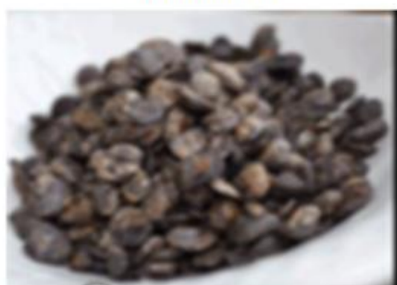
Graine de néré

Photo: © Chadare, Toucountouna (Benin), Août 2015