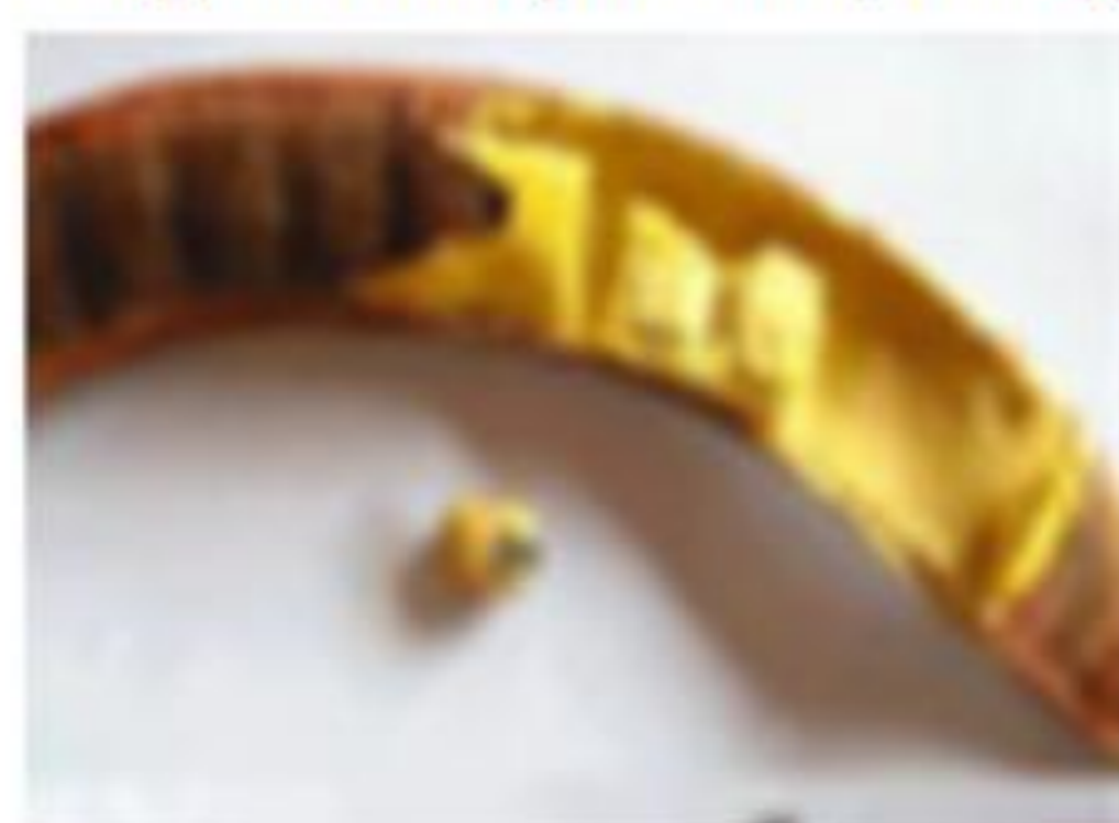
Pulpe de néré ( Parkia biglobosa )

Photo: © Chadare, Karimama (Benin), Août 2015