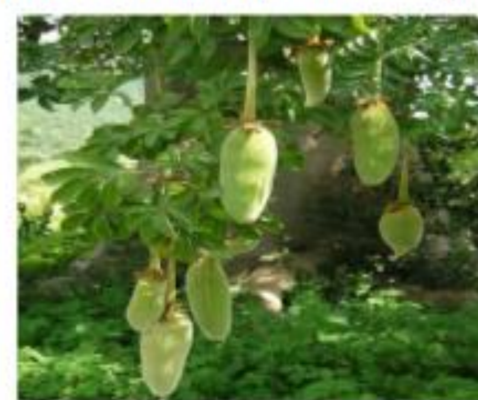
Feuille de baobab ( Adansonia digitata )

Photo: © Chadare, Karimama (Benin), Août 2015