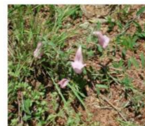
Feuille de faux sésame

Photo: © Chadare, Karimama (Benin), Août 2015