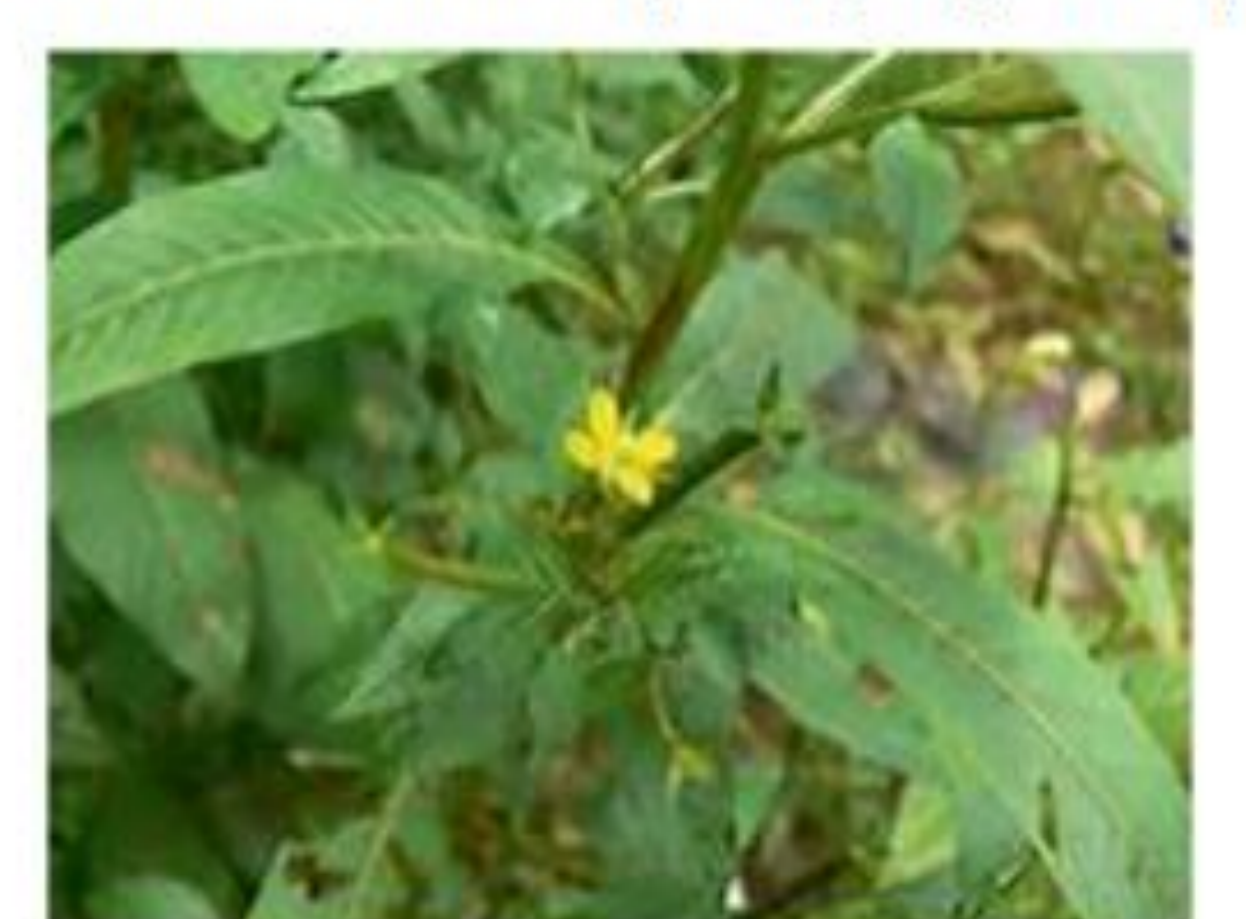
Feuille de Toloman ( Ludwigia perennis )

Photo: © Chadare, Zakpota (Benin), Août 2015