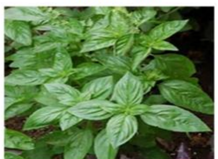
Feuille de Basilic

Photo : © Chadare, Coby (Benin), Août 2015