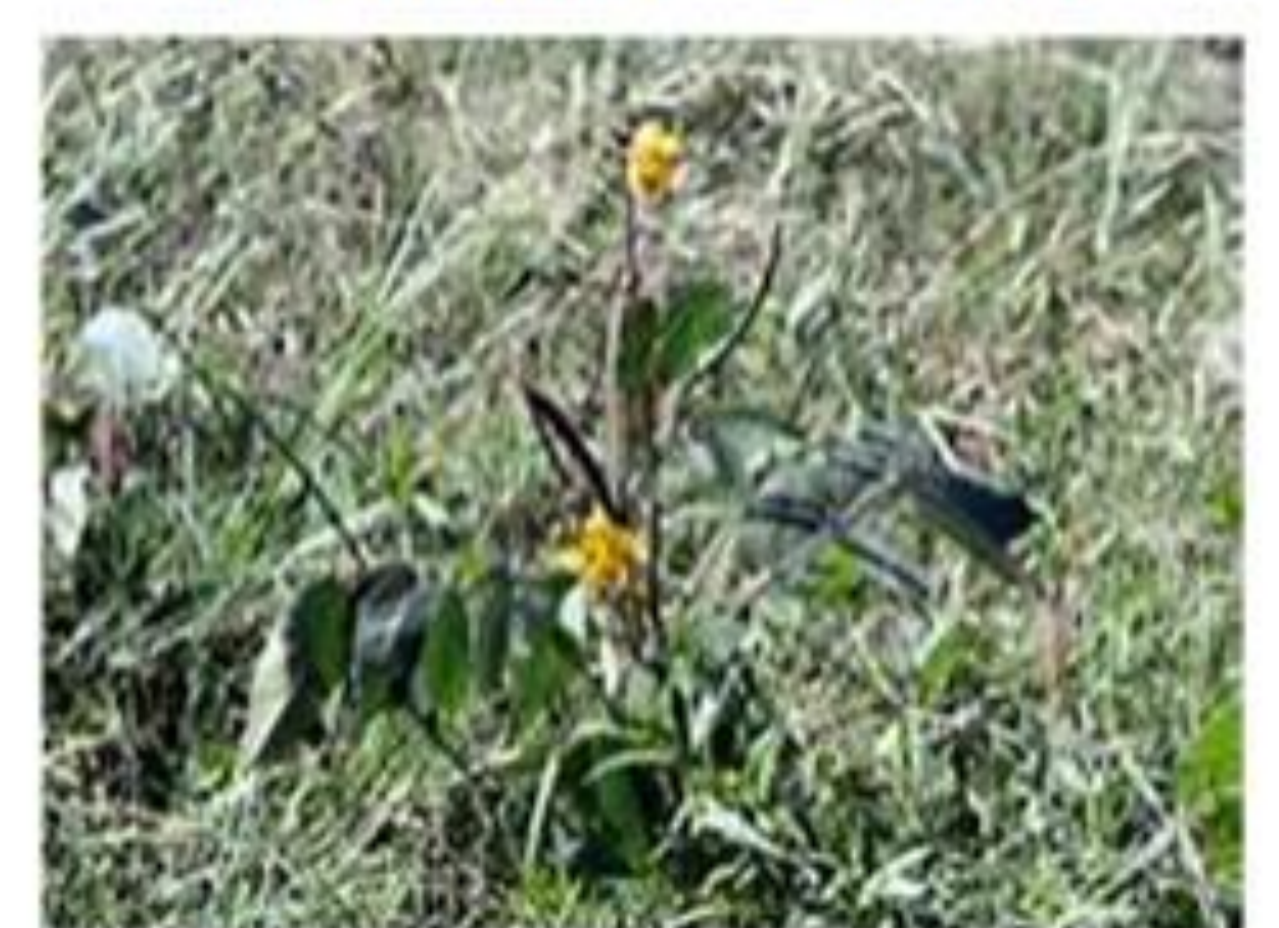
Feuilles de faux kinkéliba

Photo: © Chadare, Banikoara (Benin), Août 2015